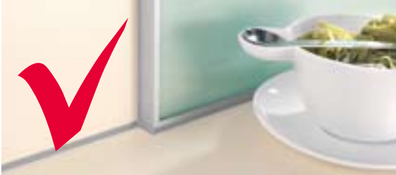
Kontrollieren Sie regelmäßig die Silikon-Abdichtungen entlang der Rückwände, rund um die Spüle und bei Aufsatzschränken. Diese Dichtungen dürfen beim Reinigen nicht zerkratzt werden; beschädigte Abdichtungen müssen erneuert werden. Allfällige Wasserschäden aufgrund beschädigter Silikonabdichtungen sind kein Reklamationsgrund!