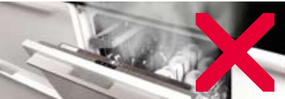
Öffnen Sie den Geschirrspüler immer erst etwa 30 Minuten nach Programmende! Bei frühzeitiger Öffnung treten Hitze und Dampf aus und schädigen – trotz Verwendung von hochwertigen Materialien und gewissenhafter Verarbeitung – langfristig die angrenzenden Fronten, Korpussteile und Kanten sowie die Arbeitsplattenunterseite. Schäden, die durch unsachgemäße Handhabung auftreten, sind kein Reklamationsgrund. Bei Geräten mit Tonsignal zur Anzeige des Betriebsendes, das Gerät erst 30 Minuten nach dem Tonsignal (Betriebsende) öffnen!