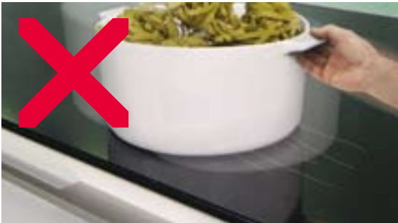
Töpfe und Keramik (Teller, Vasen etc.) nicht auf der Arbeitsplatte schieben; unabhängig von der Arbeitsplattenoberfläche besteht die Gefahr des Zerkratzens.