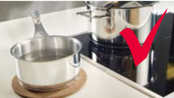
Stellen Sie - unabhängig von der Arbeitsplattenoberfläche – heiße Töpfe und Pfannen auf einer geeigneten Unterlage ab.