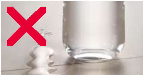
Auf den Stoßfugen der Arbeitsplatten keine Blumentöpfe, Kaffee- oder Espressomaschinen, Wasserkocher und ähnliche Geräte abstellen, bei denen die Gefahr des Überlaufens besteht. Verschüttetes Wasser dort gleich abwischen.

Kunststoff-beschichtete Arbeitsplatten reinigen Sie am besten mit haushaltsüblichen Reinigungsmitteln oder einfach mit handwarmem Wasser, etwas Spülmittel und einem weichen Tuch (Baumwolle). Verunreinigungen müssen sofort entfernt werden, damit sie nicht eintrocknen. Eventuelle Feuchtigkeitsrückstände vermeiden Sie, indem Sie nach der Reinigung mit einem trockenen, weichen Tuch nachwischen. Hartnäckige Flecken wie Fettspritzer oder Klebstoffreste können mit einem handelsüblichen Kunststoffreiniger beseitigt werden. Prüfen Sie zur Sicherheit das Mittel vor der ersten Anwendung an einer weniger sichtbaren Stelle. Scheuernde oder polierende Reinigungsmittel, harte, kratzende Schwämme, Bürsten und Microfasertücher sind für die Reinigung von Kunststoff-beschichteten Arbeitsplatten ungeeignet! Verwenden Sie keine Reinigungsmittel, die folgende Stoffe beinhalten: Azeton, Chlorkohlenwasserstoff, Nitroverdünnung, Lösungen, die mit „Tri“ oder „Tetra“ beginnen!