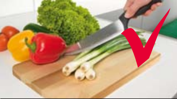
Schneiden Sie nicht direkt auf der Arbeitsplatte; verwenden Sie – unabhängig von der Arbeitsplattenoberfläche – immer ein Schneidbrett.